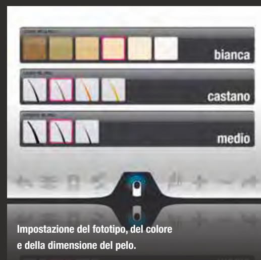
Impostazione del fototipo, del colore e della dimensione del pelo.

Permette di visualizzare immagini, programmi, dati cliente, parametri e percorsi di lavoro garantendo una consultazione capillare dei trattamenti e di tutte le funzioni.