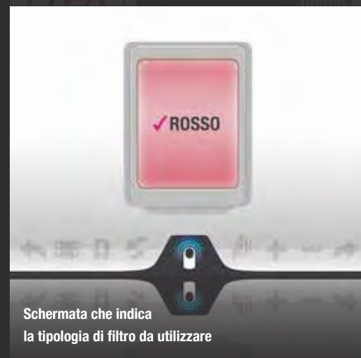
Schermata che indica la tipologia di filtro da utilizzare