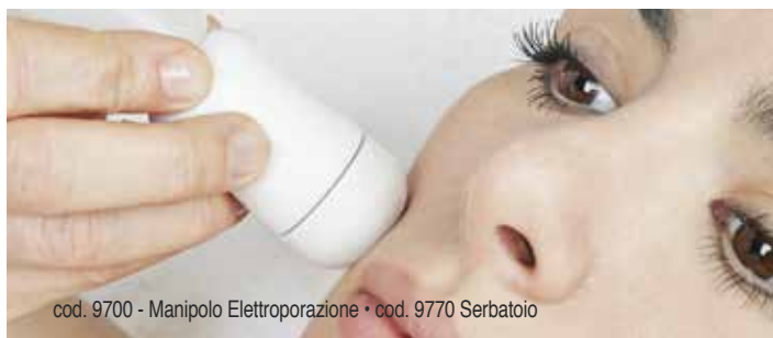
cod. 9700 - Manipolo Elettroporazione • cod. 9770 Serbatoio

L'Elettroporazione, attraverso l'emissione di impulsi elettrici, contribuisce ad aprire canali nel derma per veicolare in profondità qualsiasi tipo di sostanza applicata, scelta in base all'inetestismo da trattare.