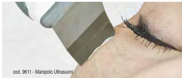
cod. 9611 - Manipolo Ultrasuoni

Azione di pulizia profonda e penetrazione dei principi attivi. Unisce l'effetto degli Ultrasuoni alla vibrazione esercitata dalla spatola per effettuare un peeling meccanico e trattamenti viso. Le diverse frequenze utilizzate permettono di svolgere un'azione rigenerante, tonificante, elasticizzante con ottimi risultati su tutti i tipi pelle avvalendosi di 14 programmi specifici.