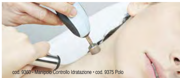
cod. 9360 - Manipolo Controllo Idratazione • cod. 9375 Polo

La funzione di "Controllo Idratazione" permette di rilevare la percentuale di idratazione sul viso sfruttando un leggero passaggio di corrente, effettuando una valutazione iniziale pre-trattamento.