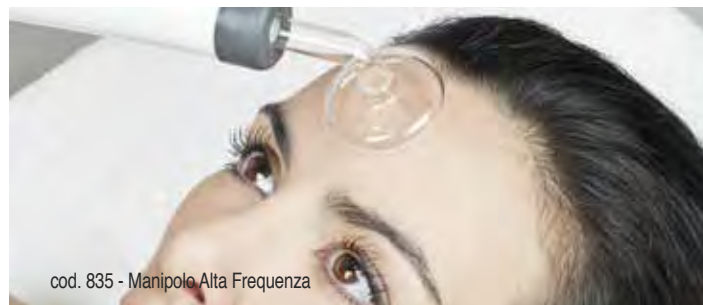
cod. 835 - Manipolo Alta Frequenza

Utilizzando l'applicazione diretta della corrente di Tesla (corrente alternata) si ottengono azioni che sommate tra loro purificano e migliorano le condizioni della pelle trattata. Infatti, la luce blu, usata esternamente per via diretta, ha un grande potere di penetrazione che genera calore all'interno dei tessuti trattati. La luce blu ha inoltre un'azione germicida.