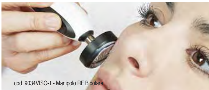
cod. 9034VISO-1 - Manipolo RF Bipolare

Tramite l'onda diatermica permette di riportare a un adeguato sistema di vascolarizzazione tutte le zone trattate e di stimolare alcuni processi naturali, quali la produzione di collagene, elastina e acido ialuronico e incrementare la loro azione.