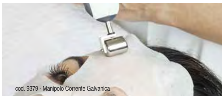
cod. 9379 - Manipolo Corrente Galvanica

È utilizzata per ottenere sia un'azione di disincretazione cutanea sia un'azione di ionoforesi per la penetrazione dei sieri specifici. 2 programmi: Disincrostante, Ionoforesi.