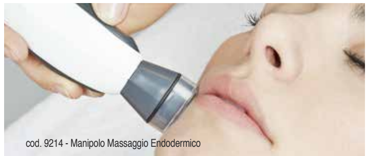
cod. 9214 - Manipolo Massaggio Endodermico

E' piacevole ed efficace come un massaggio manuale, ma consente un trattamento più uniforme sul viso e meno faticoso per l'estetista. Adotta un nuovo principio brevettato di Vacuum-Massaggio che utilizza una delicata azione di aspirazione e rilascio per evitare danni al derma e alla rete capillare.